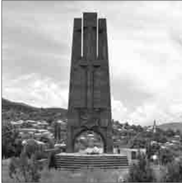
Ծղաթբիլա. Երկրորդ աշխարհամարտում զոհված ծղաթբիլացիների հիշատակը հավերժացնող հուշարձանը