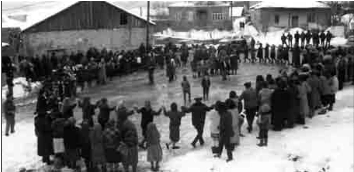
Ծղալթբիլա. Բարեկենդանի տոնակատարությունը (լուս.՝ 1989 թ.)

Հակոբ Քոսյան . 1830 թ. իր հետ կարողացել է բերել 2 կտավ, որոնք նախ նվիրել է աղոթարանին, ապա եկեղեցուն 47 : Վախճանվել է 1838 թ.: Անփութված է գյուղի գերեզմանոցում: