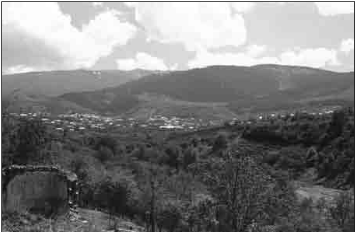
Ծղալթբիլա. ընդհանուր տեսքը հյուսիսից (լուս.՝ 1988 թ.)

Տեղադրություն. գտնվում է Ախալցխայից ուղիղ գծով 12 կմ հարավ-արևմուտք՝ Փոցխով գետի աջ ափից 1,5-2 կմ հեռավորության և ծովի մակերևույթից 1240-1350 մ բարձրության վրա. «Ծղալթբիլայ Ախալցխայի հարավ-արևմտեան կողմը կիյնայ, եւ հետիոտս չորս ժամ հեռատրութիւն ունի քաղքէն: Գիւղս շինուած է ցած բլրակներու վրայ, առաջակողմն ունի դաշտագետիւններ՝ ցորենի եւ գարոյ արտեր, իսկ կոնակը կը բարձրանան անտառաշատ լեռնակներ...» 1 :