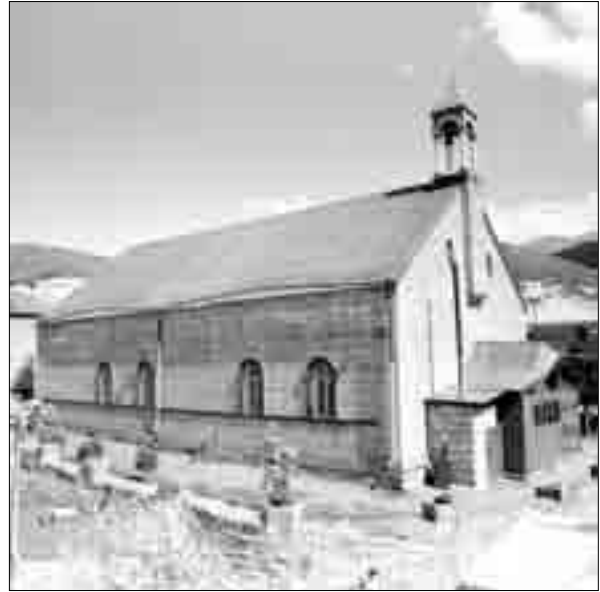
Ծղաթբիլա. Սբ. Փրկիչ եկեղեցու տեսքը հյուսիս-արևմուտքից (լուս.՝ 1988 թ.)

Հիվանդանոց. 1914 թ. Ծղաթբիլայի գյուղական հիվանդանոցը ծխական դպրոցի շենքից փոխադրվում և հաստատվում է հասարակության միջոցներով մասնավորապես որպես հիվանդանոց կառուցած նոր շենքի մեջ 27 :