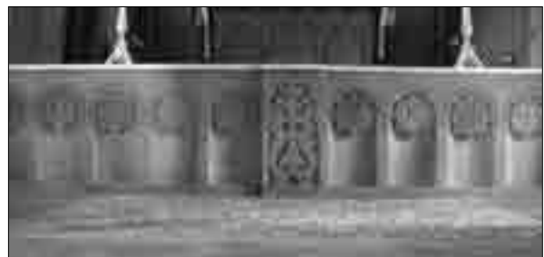
Ծղալթբիլա. Սբ. Փրկիչ եկեղեցուն հարող թաղամասը հարավ-արևմուտքից, արձանագրություններ և հարթաքանդակ հարավային ճակատին, ներքին տեսքը դեպի արևելք և հատված բեմի ճակատամասից (լուս.՝ 2007 թ.)