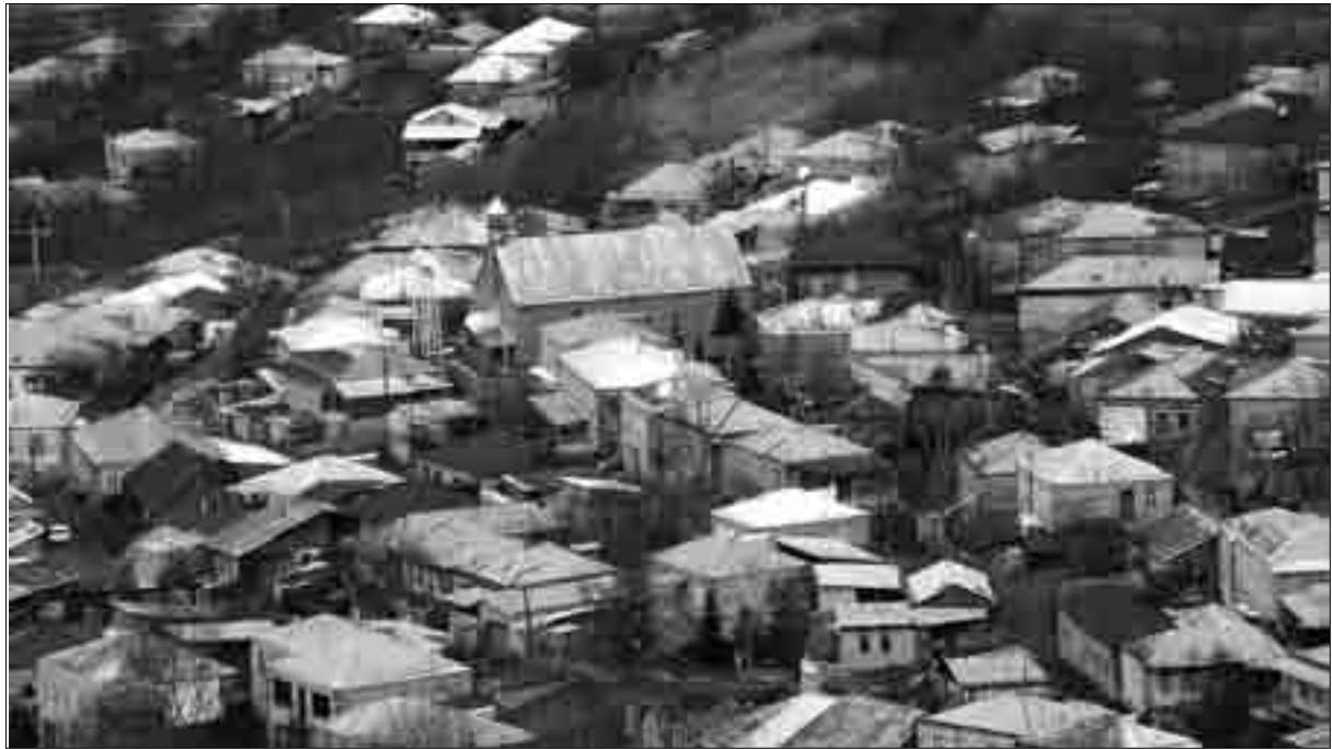
Ծղալթբիլա. ընդհանուր տեսքը հյուսիսից (լուս.՝ Ա. Մելիքսեբյանի, 2007 թ.)

Վիճակագրություն. առանց այն էլ սակավաթիվ տեղեկագրերից մի քանիսում Ծղալթբիլայի բնակչության թվաքանակը ցույց է տրված մոտակա գյուղի հետ միատեղ, ուստի որոշ դեպքերում հնարավոր չէ նշյալ գյուղերից յուրաքանչյուրի համար առանձին տվյալներ գտնել: Այդպիսին է, օրինակ, 1913 թ. տեղեկագիրը, որտեղ Ծղալթբիլայի բնակչության թվաքանակը ներառում է նաև մերձակա Ջուլդա գյուղի բնակչության թիվը: Սրանով հանդերձ՝ ըստ ժամանակագրության ստորև ներկայացնում ենք վիճակագրական տվյալների համադրված պատկերը.