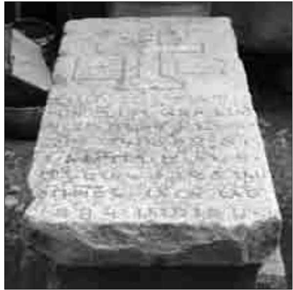
Ծղալքբիլա. քահանաների տապանաքարեր եկեղեցու բակի գերեզմանոցում (լուս.՝ 2007 թ.)