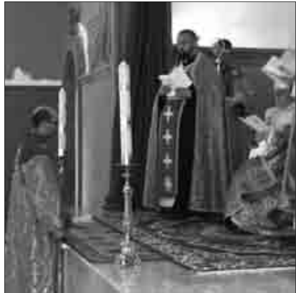
Ծղալթբիլա. հոգևոր արարողություն Սբ. Փրկիչ եկեղեցում (լուս.՝ Լ. Մոսյանի, 2007 թ.)