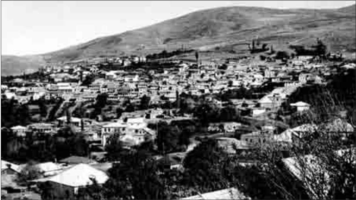
Ծղալթբիլա. ընդհանուր տեսքը հյուսիսից (լուս.՝ հայր Վահան Գովհաննիսյանի, 1960 թ.)

հանքում կառուցվել է ալեբաստրի (սալիտակ, քափանցիկ գաջաքար) գործարան, որի հումքը տեղափոխվել է Վրաստանի տարբեր շրջաններ, հիմնականում՝ Թբիլիսի 4 :