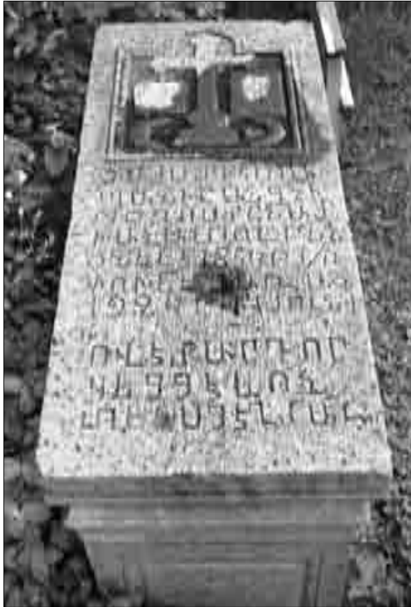
Ծղալթքիլա. տեր Պողոս Խաչատուրյանի տապանաքարը (լուս.՝ 2007 թ.)

գարգացնելու ուղղությամբ: Միմոն Գիլանյանցի թոռն էր՝ տեր Սկրտչի որդին: Ստալինյան բռնատիրության զոհերից է: Տապանաքարը գտնվում է եկեղեցու բակում: